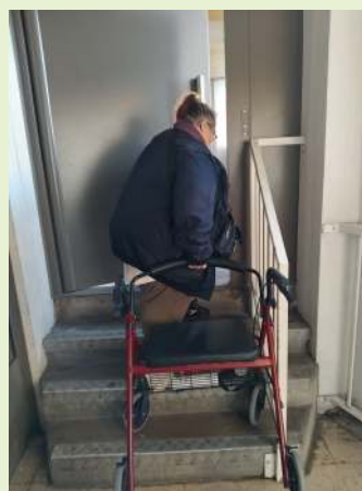
Punaise ces marches !