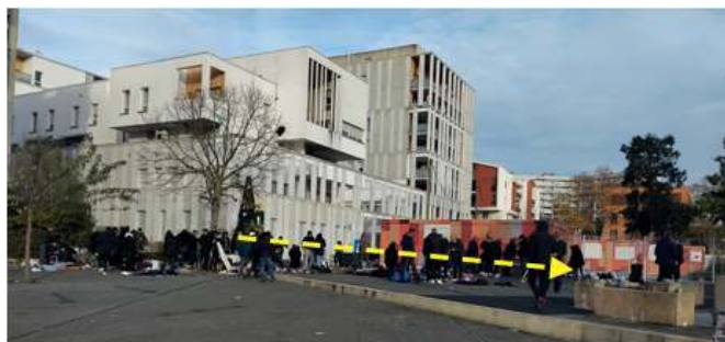
Place Abbal : la flèche jaune montre la foule qu'il faut traverser, sans compter les obstacles au sol, quand on veut accéder à l'ascenseur du métro en évitant la marche.