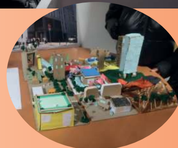
Balade contée et lumineuse (Parle avec elles) le 28 novembre de l'école Simone Veil à Générations Réunies au Varèse