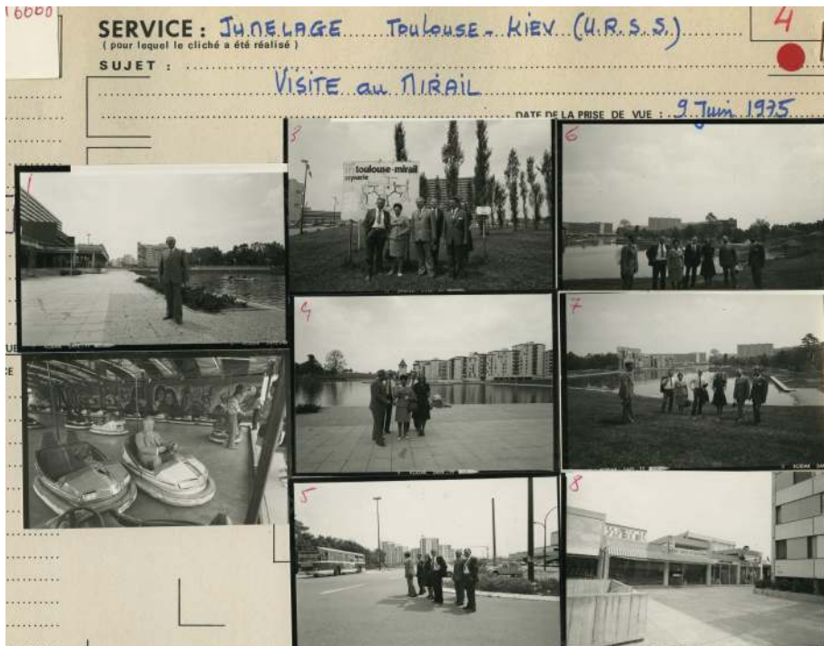
© Ville de Toulouse, Archives municipales, 15Fi6668

En 2024, En Quête de Patrimoine a lancé un nouveau projet sur les quartiers du Mirail. Topomusique ! que nous rebaptisons triptyque, plus large et renvoyant à beaucoup d'éléments du quartier (on vous laisse réfléchir ...), car Le Mirail se transforme. A Reynerie, les immeubles de l'architecte Candilis sont détruits et avec eux, ce sont des noms qui vont aussi disparaître. Ils sont pourtant importants et désignent des espaces plus grands que l'immeuble lui-même. Mais connaissez-vous ces noms, cette toponymie ? A Reynerie, beaucoup renvoient à des compositeurs de musique (voir le numéro 48 de Reynerie Miroir), à Bellefontaine, ce sont des peintres. Une belle occasion de découvrir ou redécouvrir ces artistes. Nous nous intéressons également à Mirail Université et vous inviterons à nos animations.