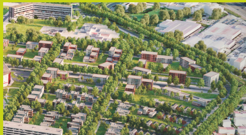
Plan du quartier en 2030 après la réalisation du projet