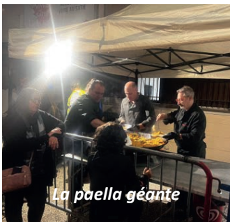
La paella géante