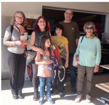
Départ de notre belle base nautique

Une belle occasion de découvrir notre beau quartier : de Reynerie à Bellefontaine, de rencontrer les associations et partenaires. Nous vous invitons à venir avec nous pour une belle promenade et à ouvrir l'oeil pour la 17 ème édition en 2025