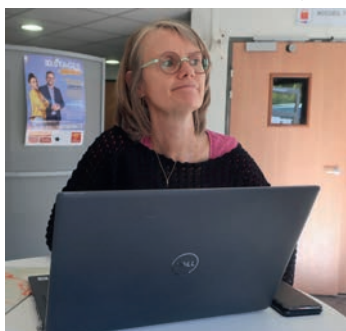
L'école de la 2 ème chance