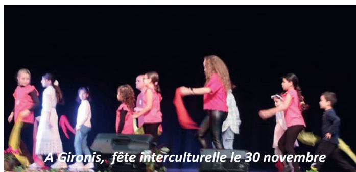
À Gironis, fête interculturelle le 30 novembre