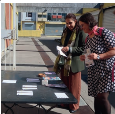
L'association Parle avec elles