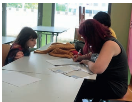
Les participants à l'enquête écrivent L'épilogue de l'enquête

J'ai aimé, sans savoir ce que ça allait donner, découvrir ce quartier. J'ai rencontré des gens actifs. Ecrire c'est important, créer du lien social, du lien avec Polars du Sud, la librairie de la Renaissance.