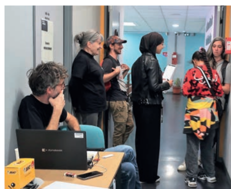
Au centre Alban Minville, interviews de trois suspects