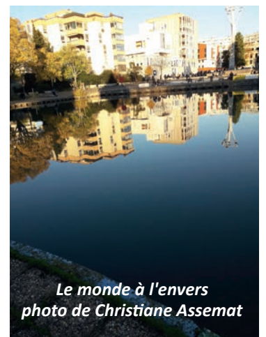
Le monde à l'envers

La signalétique reste cependant très approximative, une vérification régulière serait souhaitable