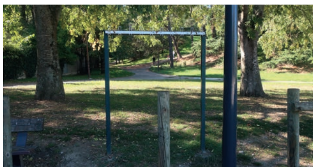
Le boulodrome près du jardin des douves