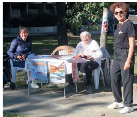
L'association Bel'arc en ciel