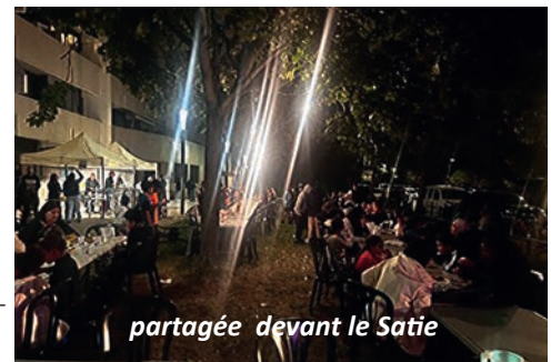
partagée devant le Satie

L'association est également très impliquée dans le village champêtre co-organisé par Reynerie Services, Vivre au Satie, le centre social (photos ci-dessous)