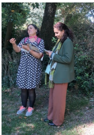
Découvrir le parc du château, le tulipier de Virginie, son bassin et ses palmiers, ses arbres somptueux