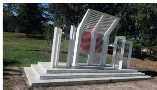
Au Parc Clairfont, le monument aux langues maternelles internationales