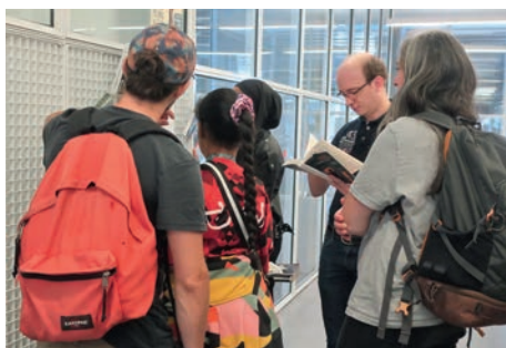
La médiathèque Grand M, et les oeuvres de Benoit Severac et d'Amina B