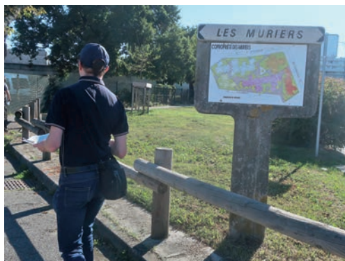
Le lotissement "Les Muriers"