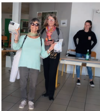
Le centre Abbal