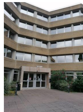
Entrée principale puis 1 er étage